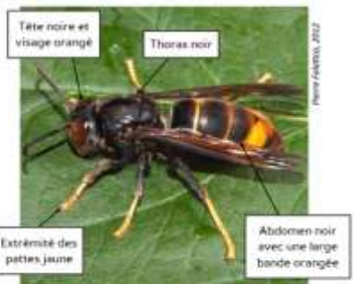
Taille: ouvrière: 25 à 30 mm reine: 35 mm maxi