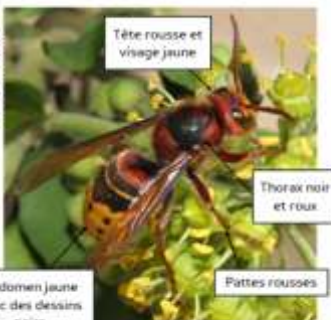
Taille: ouvrière: 25 à 35 mm reine: 40 mm maxi