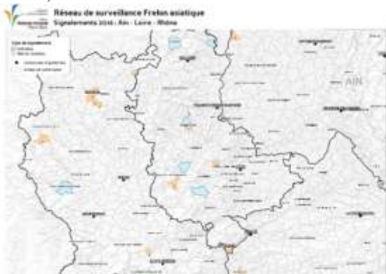
Carte 1 : carte représentative des signalements confirmés de frelon asiatique (nids et individus) sur les départements de la Loire, du Rhône et de l'Ain

En 2015 et 2016, le climat lui a été très favorable, ce qui lui a permis de coloniser de nouvelles zones géographiques et de se développer sur sa zone de présence connue (voir Carte 1) :